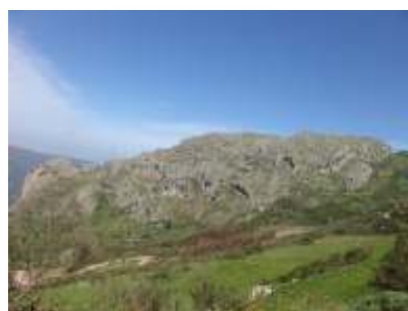
Rocche del Crasto