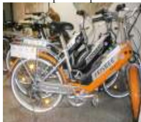
Bici a pedalata assistita