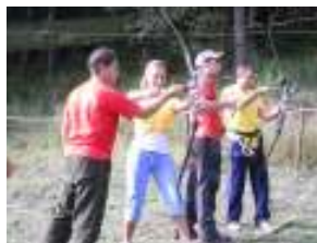
Tiro con L'Arco